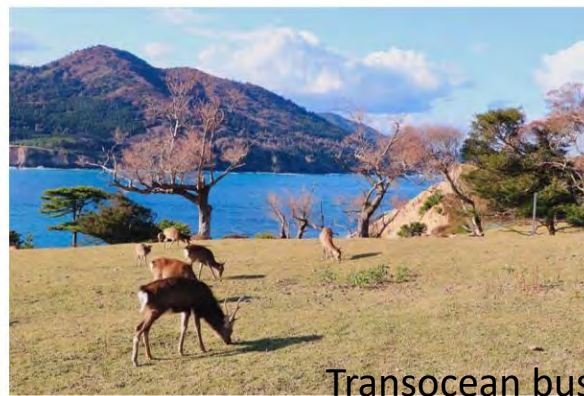
Transocean bus group